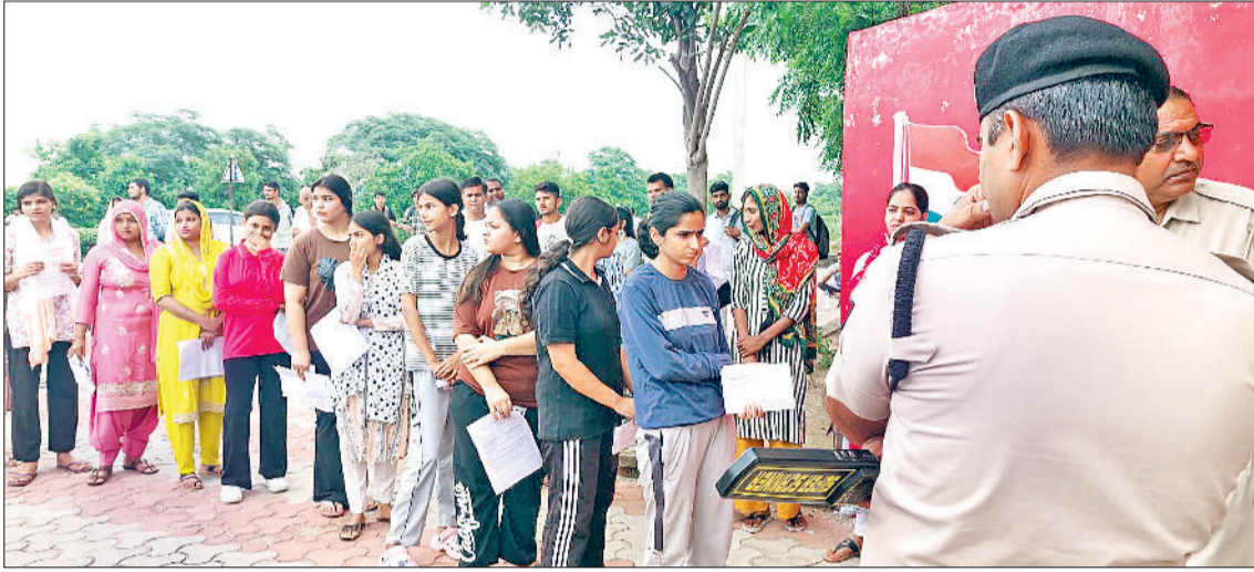
झज्जर। जिले के एक परीक्षा केंद्र के बाहर कतारबद्ध खड़े परीक्षार्थी व सेंटर के बाहर मुस्तेद खड़े पुलिस अधिकारी।

समाजसेवी भी नहीं रहे पीछे- अभिभावकों के लिए किया चाय-पानी का प्रबंध