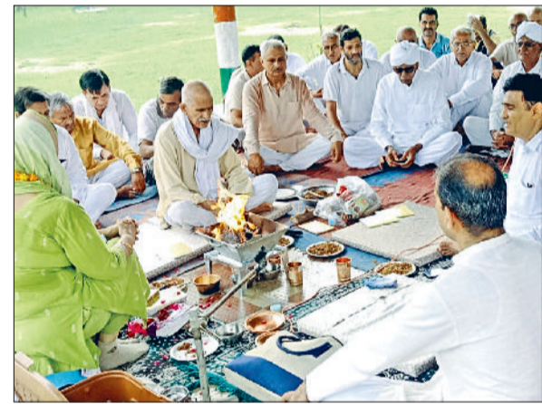
बहादुरगढ़ | रविवार को सेक्टर-2 पार्क में हवन करते आर्य समाजी।