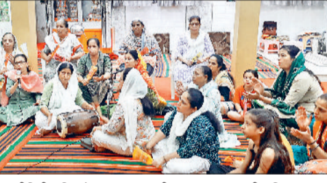
झज्जर | बाबा काशीगिरी मंदिर में श्रावण मास की कथा श्रवण करती महिलाएं।