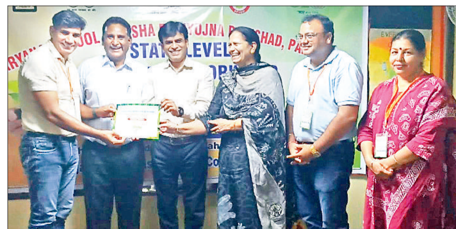
झज्जर। कार्यशाला में जिला कोर्डिनेटर को प्रशस्ति पत्र प्रदान करते हुए मुख्यातिथि।