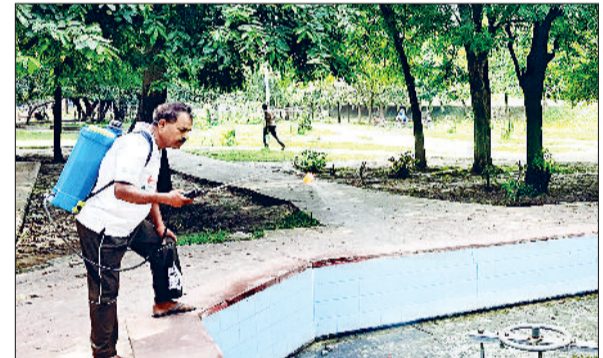
बहादुरगढ़। देवीलाल पार्क में किया जा रहा दवा का छिड़काव।