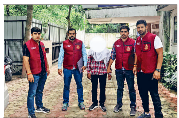
हरिभूमि न्यूज ▶▶ नई दिल्ली