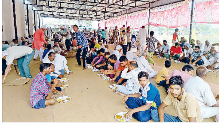
झज्जर। भंडारे में प्रसाद ग्रहण करते हुए श्रद्धालु।

■ यज्ञ करने से ना केवल आत्मिक शुद्धि होती है बल्कि यह वातावरण को स्वस्थ और शुद्ध करने में सक्षम