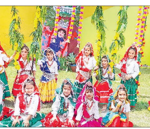
झज्जर | हरियाणवी वेशभूषा में उपस्थित नन्ही छात्राएं।