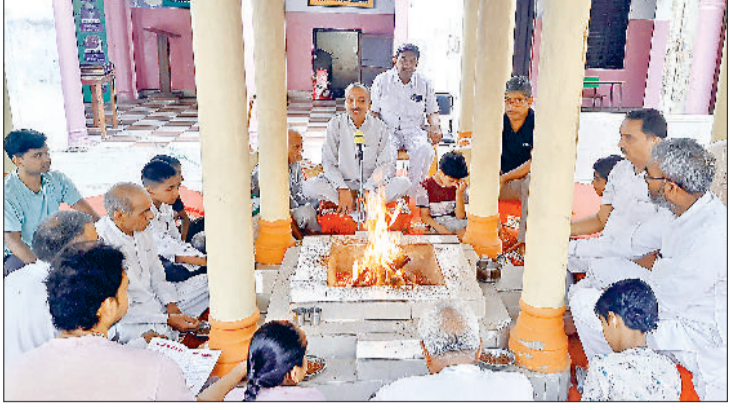
झज्जर। यज्ञ में आहुति डालते हुए आर्यजन।