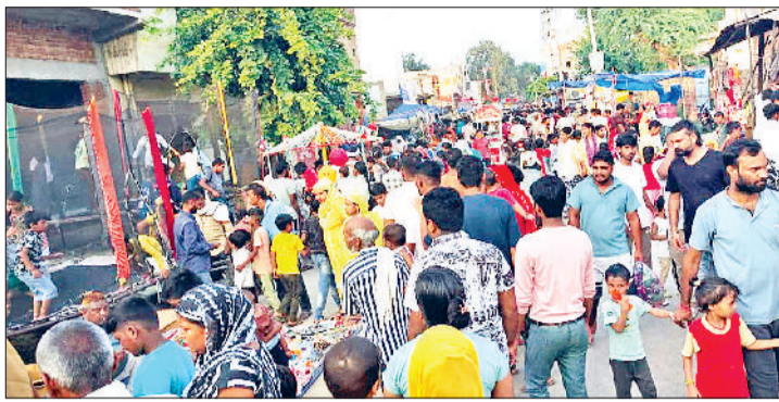
झज्जर | तीज मेले में लगी लोगों की भीड़ व मेला में लगाया हेलीकॉप्टर का प्रारूप जो बच्चों के लिए आकर्षण का केंद्र।

रविवार को तीज पर्व जिलेभर में धूमधाम से मनाया गया। सुहागिन महिलाओं ने ब्रत रख कर अपने पति व संतानों की लंबी उम्र की कामना करते हुए भगवान शिव से सुख-समृद्धि की कामना की। तीज पर्व को पूर्व रात्रि महिलाओं द्वारा अपने फाल्गुन के तौर पर मेहंदी रचवाई गई। शहर के त्रिमूर्ति मंदिर के पीछे तीज मेला लगा। जिसमें लोगों ने जमकर खरीददारी की। इस बार मेले में पहले की अपेक्षा अधिक भीड़ रही। तीज मेले में छोटे व बड़े झूले, मिकी माउस झूलों के श्री-डी हेलीकॉप्टर राइडिंग भी आकर्षण का केंद्र रहे। यहां एक ट्राला पर हेलीकॉप्टर का प्रारूप बनाया गया था। जिसमें बिठाकर बच्चों व बड़ों को श्री-डी फिल्म के जरिए हेलीकॉप्टर राइडिंग का एहसास कराया जा रहा था। महिलाएं भी पारंपरिक रीति रिवाजों को निभाते हुए मेले में पहुंची। यहां उन्होंने अपनी जरूरत के हिसाब से श्रृंगार व रूप सजा का सामान खरीदा।