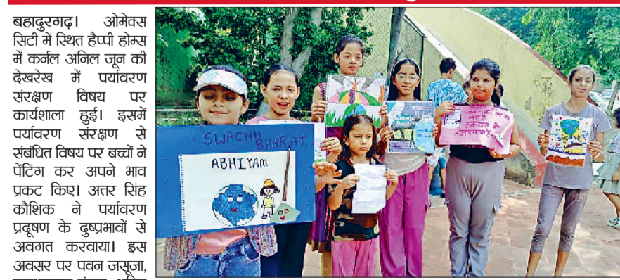
बहादुरगढ़। ओमेक्स में हुई कार्यशाला में बनाई पोर्टर्स दिखाते बच्चे।